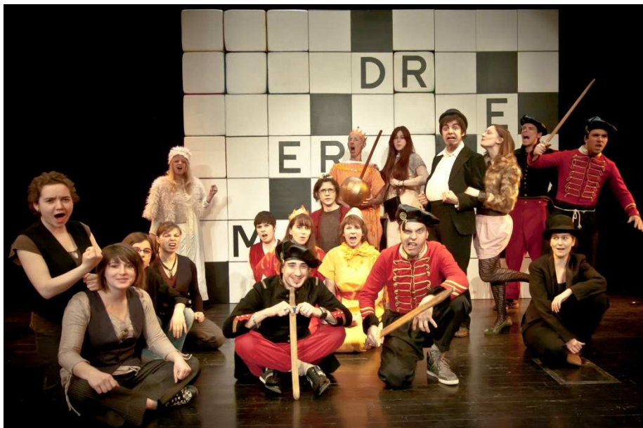
Les étudiants de Lorraine en répétition, à l'Amphi. Déléage.